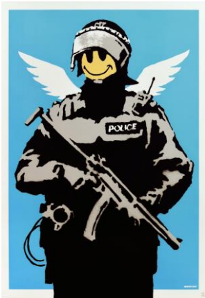
Banksy 《Flying Copper》 2004, Serigraph on paper, Private Collection