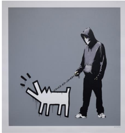
Banksy 《Choose your weapon》 2010, Serigraph on paper, Private Collection