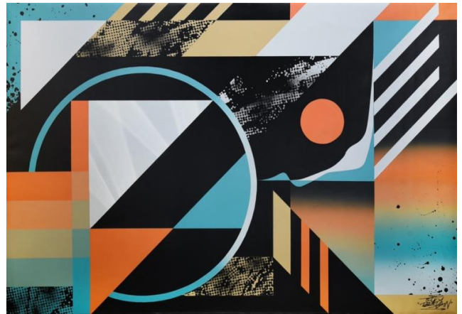
Truly Design 《Akira》 2023, Acrylic and spray on canvas

This exhibition is curated by Patrizia Cattaneo Moresi, in collaboration with 24 Ore Cultura and Artrust. The exhibition is a private collection, not authorized by the artist Banksy and anonymous Street Artists.