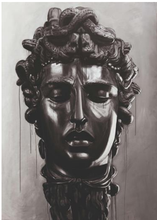
Ozmo 《Medusa》 2018, Acrylic on PVC