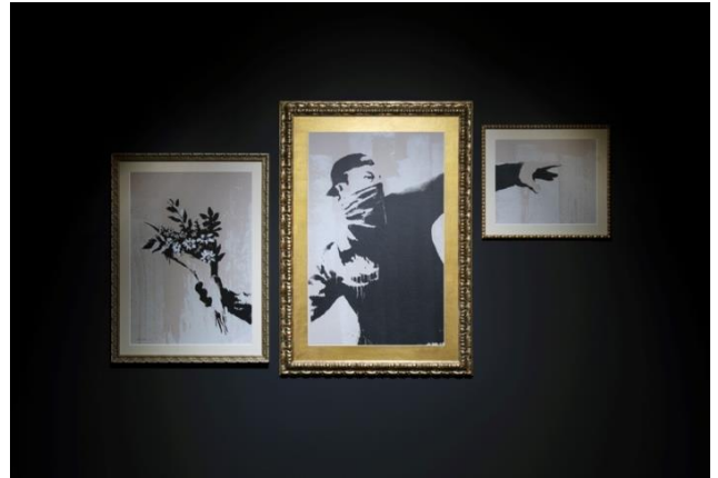
Banksy 《Thrower》 2019, Serigraph on paper, Private Collection